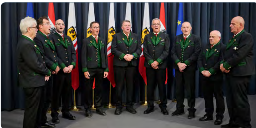
AGV Kohlröserl Ebensee