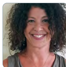
Schriftf. Gudrun Wolf-Salzer